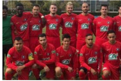
SPORTS EXPRESS Remise à jour des compteurs pour les footballeurs