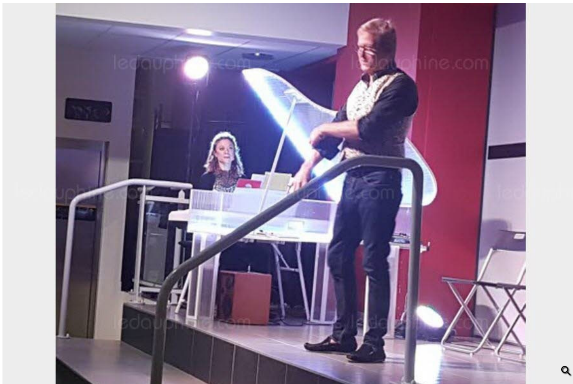
"Piano Mentalo", un spectacle peu banal...