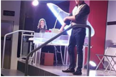
VIRY "Piano Mentalo" a ravi les spectateurs