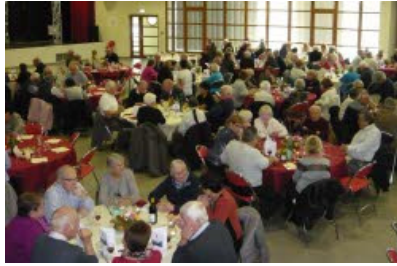
VIRY Cent soixante-dix aînés se sont régalés